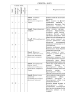
Фрагмент структури курсу

Саме в цій частині курсу студенти переходять до конкретних сфер контролю і процедур перевірки.