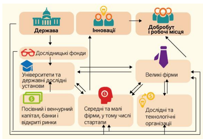
Рис. 1 – Модель інноваційного розвитку економіки [1]

При цьому головний прибуток створює інформаційна сфера, інтелект новаторів і вчених, а не матеріальне виробництво і капітал.