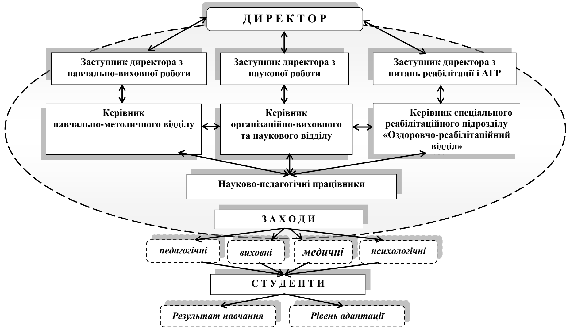
Рис. 1. Організація та взаємозв'язок роботи в спеціальному вищому навчальному закладі [4, с.24].