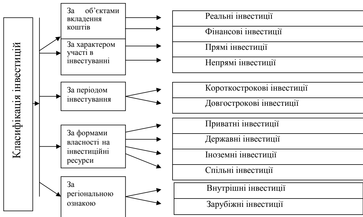
Рис.1. Структура інвестицій

За об'єктами вкладення коштів розрізняють реальні та фінансові інвестиції. Реальні інвестиції – це вкладення коштів у реальні активи: матеріальні, нематеріальні. Іншими словами, це інвестиції в майно конкретних суб'єктів (підприємств, фірм). Найпоширенішою формою реального інвестування є капітальні вкладення, під якими розуміють вкладення в будівництво та придбання основних засобів підприємств.