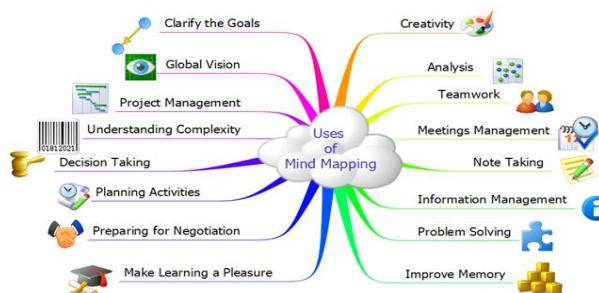
Рис 1. Приклад інтелектуальної карти

Використання даного методу є актуальним при плануванні освітнього процесу у спеціалізованих ВНЗ та інклюзивному навчанні. Враховуючи різні нозології захворювань ( внутрішніх органів, опорно-рухового апарату, ЦНС та зору, слуху) студенти не мають фізичної можливості робити конспекти лекцій, через вади здоров'я. Студент який готується до іспитів за допомогою ІК може швидко освіжити в пам'яті інформацію з будь якої теми яка структуризована і поміщена на одному аркуші паперу. Якщо студент має серйозні вади опорно-рухового апарату і взагалі не в змозі робити конспекти чи будь які записи, він може створювати цю ІК за допомогою комп'ютерної програми. Викладач маючи студентів з обмеженими можливостями може забезпечити їх уже розробленими картами.