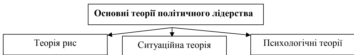
Малюнок 1 – Основні теорії політичного лідерства

Феномен лідерства намагаються пояснити багато теорій (див. мал. 1).