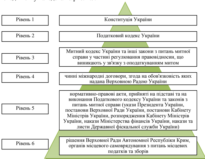
Рис. 1.5. Нормативно-правове забезпечення податкового менеджменту

Модель ієрархічної системи нормативно-правових актів податкового менеджменту наведена на рис. 1.5.