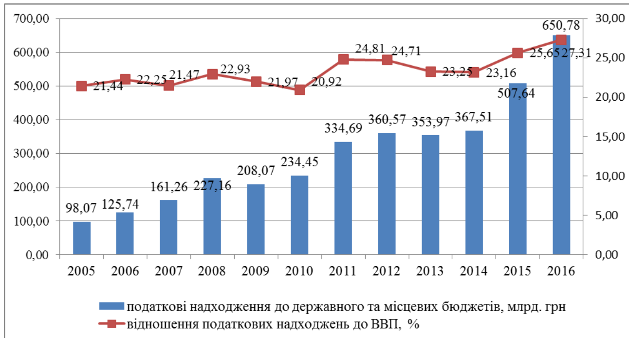
Рис. 1.2. Динаміка податкових надходжень та їх частка у ВВП у 2007–2015 рр.